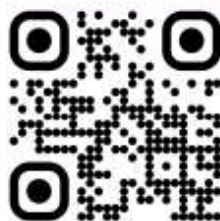
「通識積點認證系統」